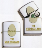
・No. TP95-W ● ¥8,025 (本体¥6,500)