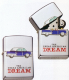
・No. TP95-D ● ¥8,025 (本体¥6,500)