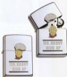
・No. TP95-S ● ¥8,025 (本体¥6,500)