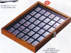
No. ZCB-36 ¥18,900 (本体¥18,000) 36ヶ入り DISPLAY ライター各モデル品 (販売品)