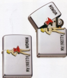
・No. TP95-M ● ¥8,025 (本体¥6,500)