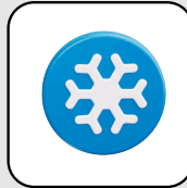
Equipos de refrigeración en general