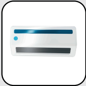
Aires Acondicionados Split