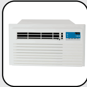
Aires Acondicionados de ventana