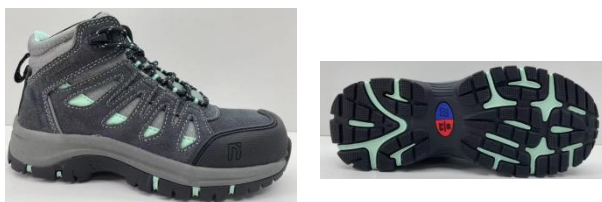
IMAGEN MODELO AMANDA CT

Cumple con el reglamento UE 2016/425 y es idéntico al EPP sujeto al certificado de la UE 0075/4873/161/03/24/0640 expedido por: