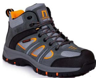
IMAGEN MODELO MANCHESTER ST

Cumple con el reglamento UE 2016/425 y es idéntico al EPP sujeto al certificado de la UE 0075/4873/161/12/23/2133 expedido por: