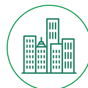
Gobierno Corporativo ·G·

Los factores ESG son determinantes del valor de largo plazo de las inversiones. Su análisis, cuantificación y comparación a través de la Calificación ESG es esencial para la mayoría de los Inversores Institucionales Internacionales.