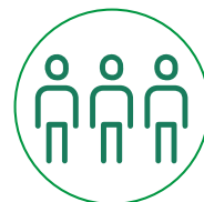
Impacto Social ·S·