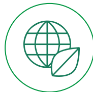
Evaluación Ambiental ·E·